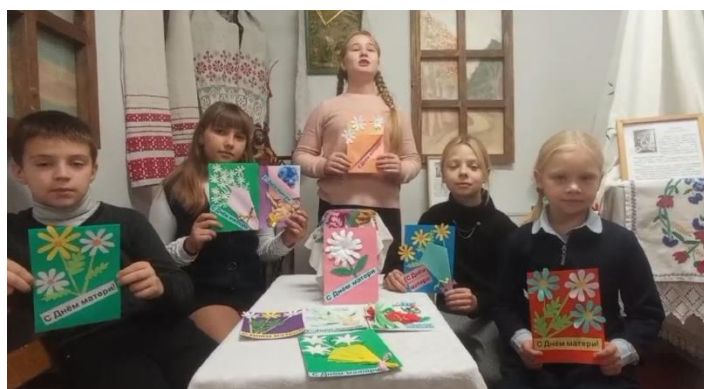
Изготовление открыток ко Дню матери

получение образования в соответствии с ценностями своей национальной культуры, которое призвано обеспечить духовное становление личности, способствовать воспитанию гражданина Республики Беларусь, формированию глубоких нравственных убеждений.