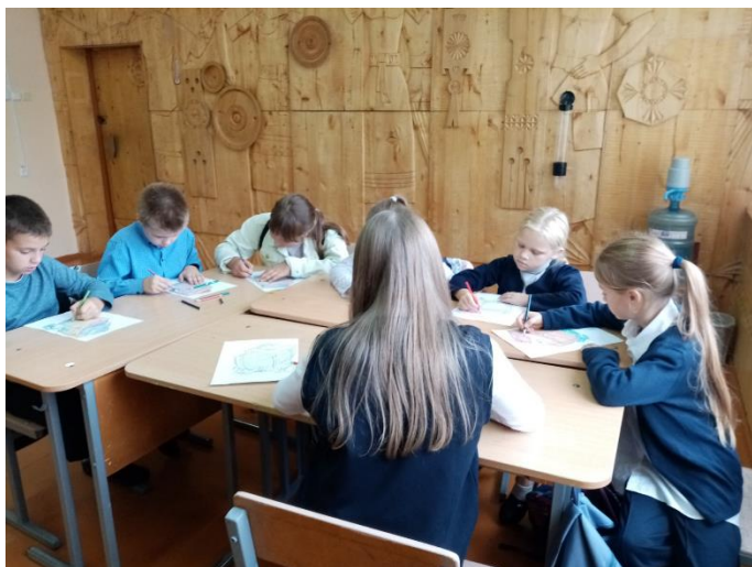
Ребята рисуют Ноев ковчег

Знакомство обучающихся со Священным Писанием осуществляется по текстам детской Библии. Чтение и обсуждение с детьми библейских сюжетов углубляет восприятие описываемых событий, помогая понять, почему Церковь на протяжении тысячелетий сохраняла память о них, и какой нравственный урок каждый человек может извлечь из них. Знакомство с основами православной нравственности продолжается через изучение Нагорной проповеди и подкрепляется доступными для детей притчами Иисуса Христа или иллюстрируется евангельскими историями. Всё это позволит перейти от эмоционального восприятия евангельских текстов к размышлению, рассуждению и выходу на самостоятельный духовно-нравственный выбор в определенной жизненной ситуации.