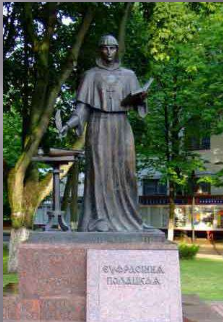
Памятник Преподобной Евфросинии Полоцкой в Минске в скверике БГУ.