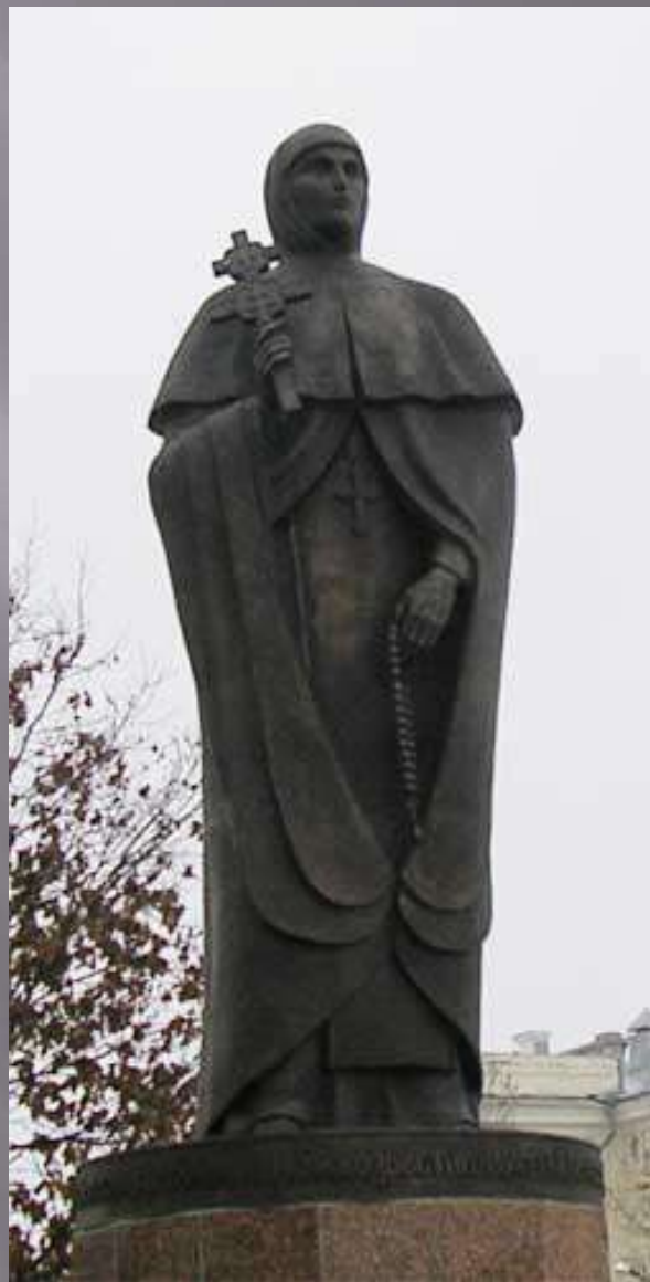
Памятник Преподобной Евфросинии Полоцкой в Полоцке.