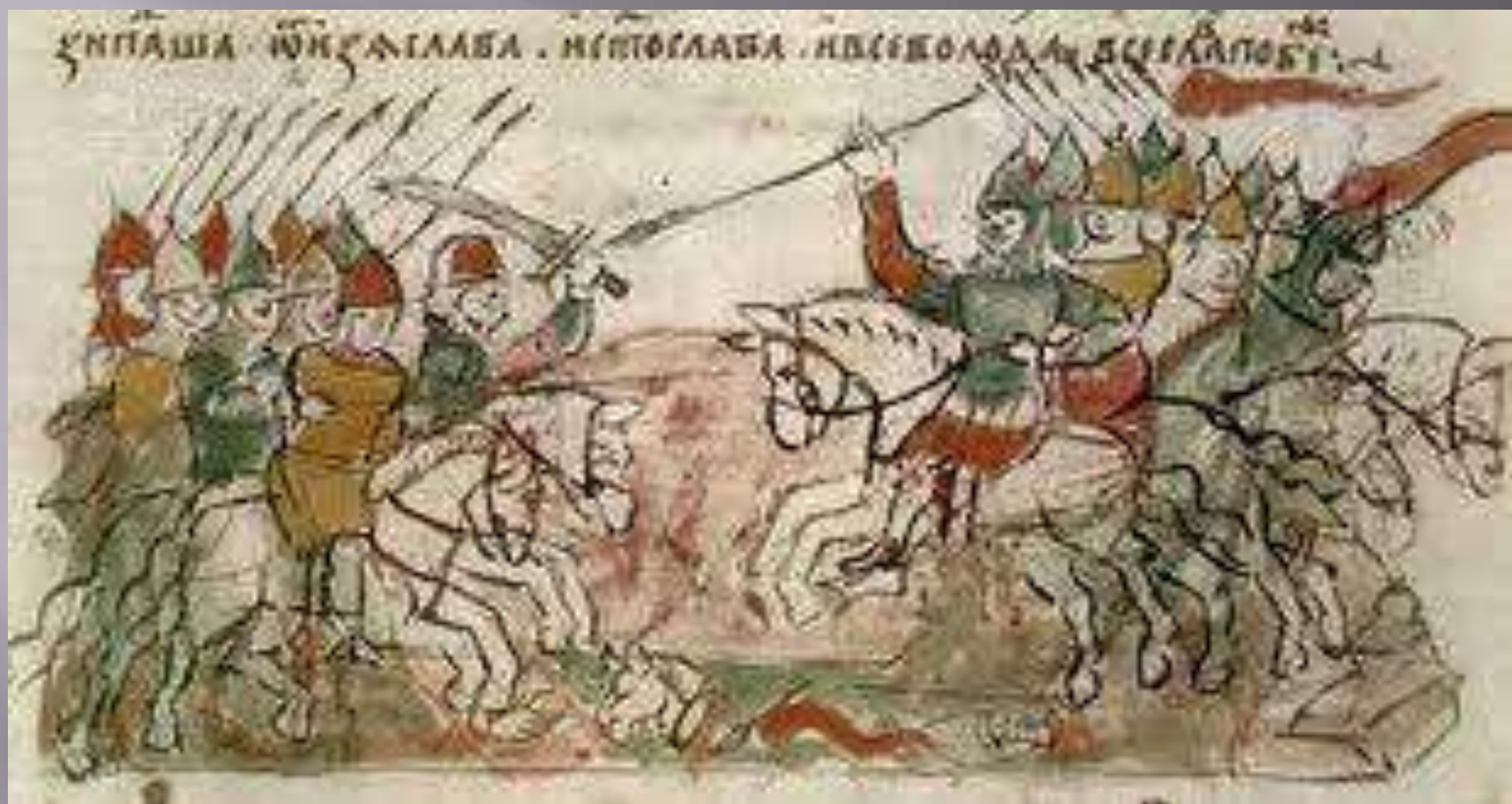
Иллюстрация из Радзивилловской летописи