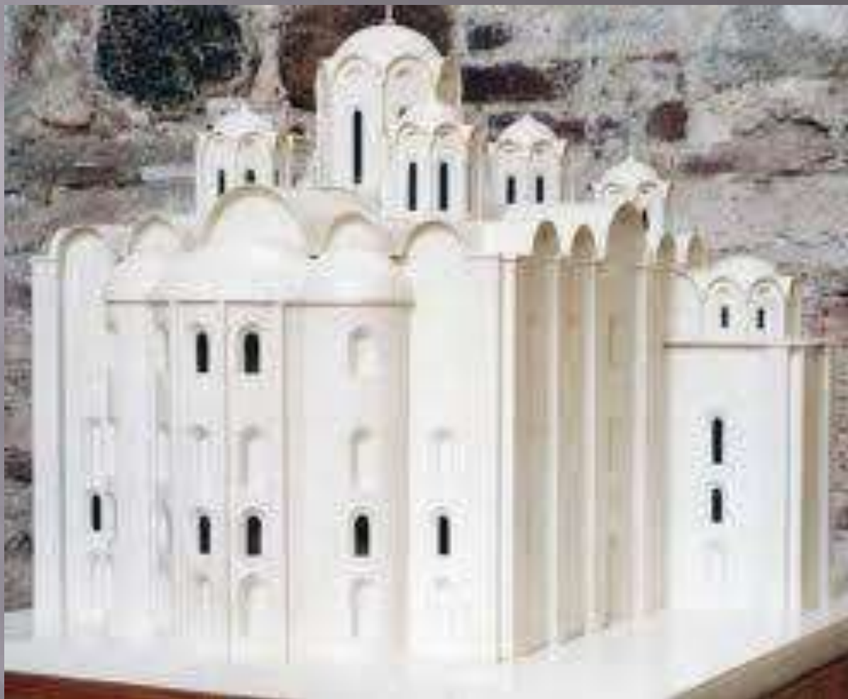
Реконструкция внешнего вида Софийского собора в Полоцке в 11 веке.