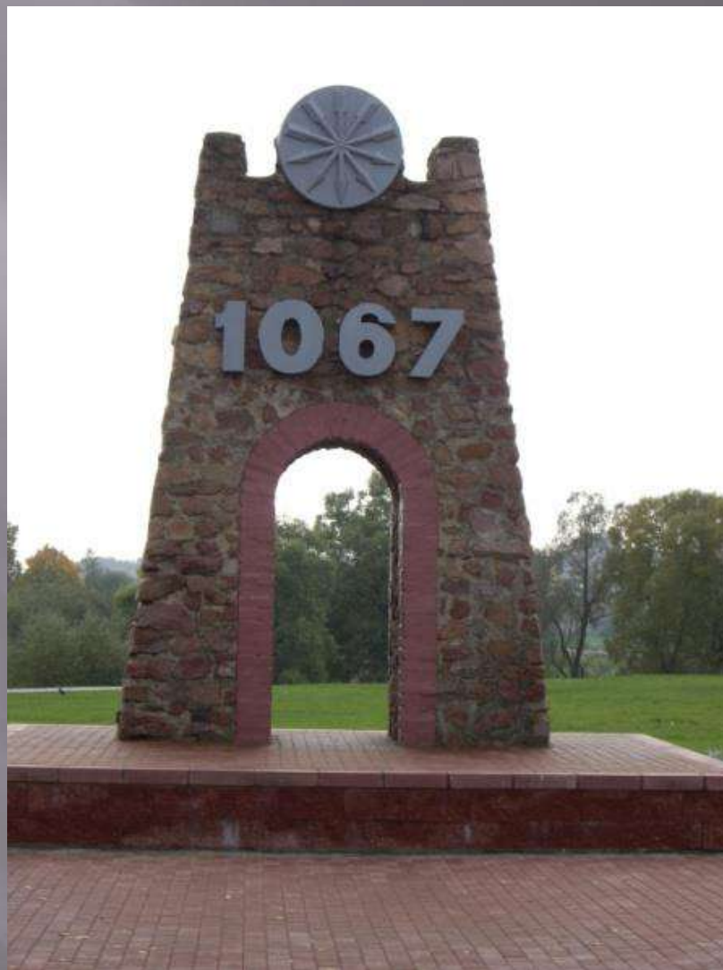
Памятный знак-арка основанию Орши на городище.