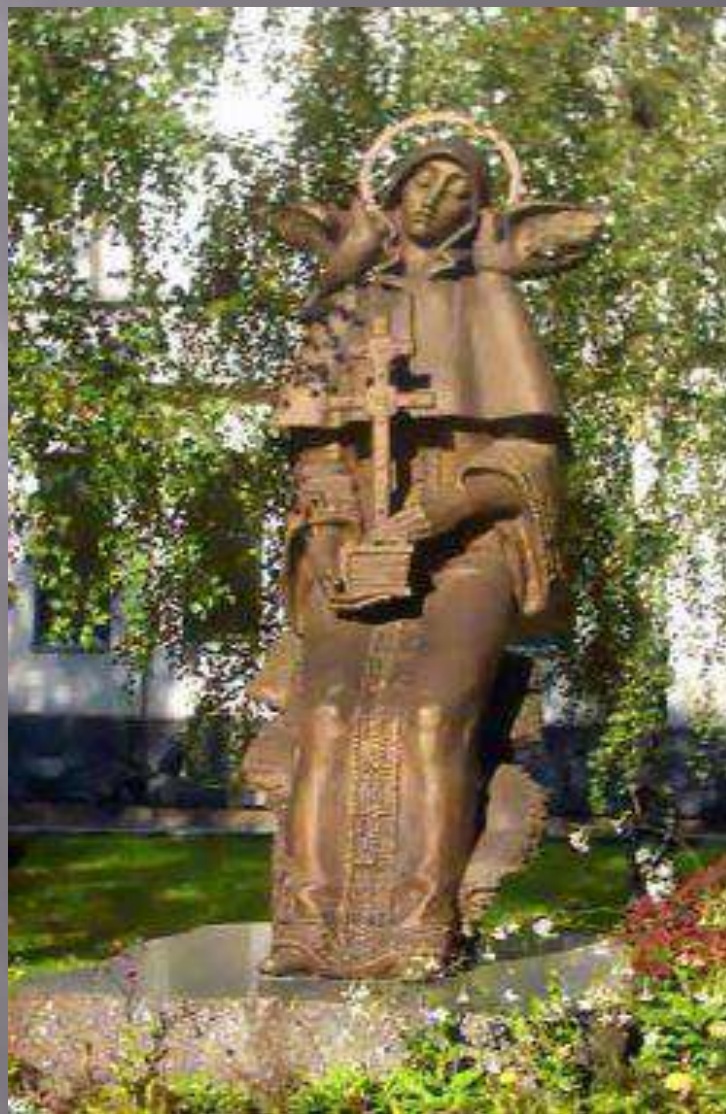
Памятник Преподобной Евфросинии Полоцкой в Минске.