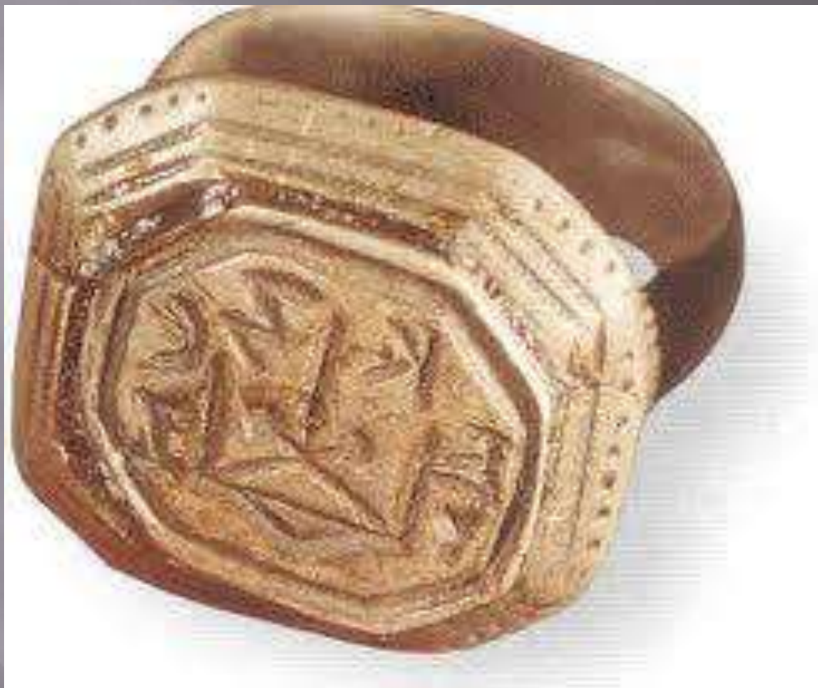
Перстень князя Всеслава. Найден в 1914 г. в районе Дисны.