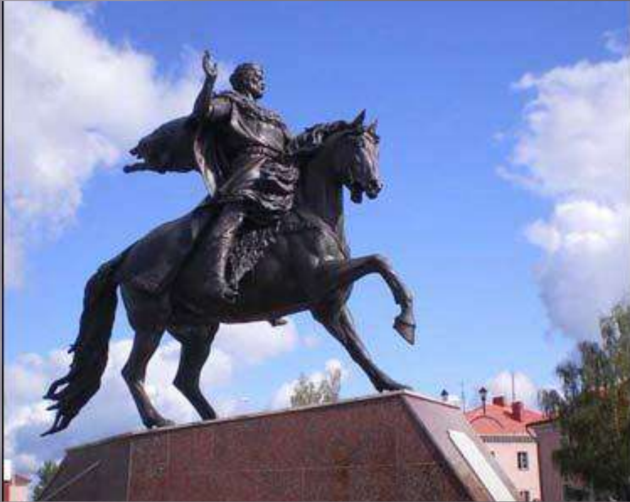
Памятник князю Всеславу Брячиславичу в Полоцке.