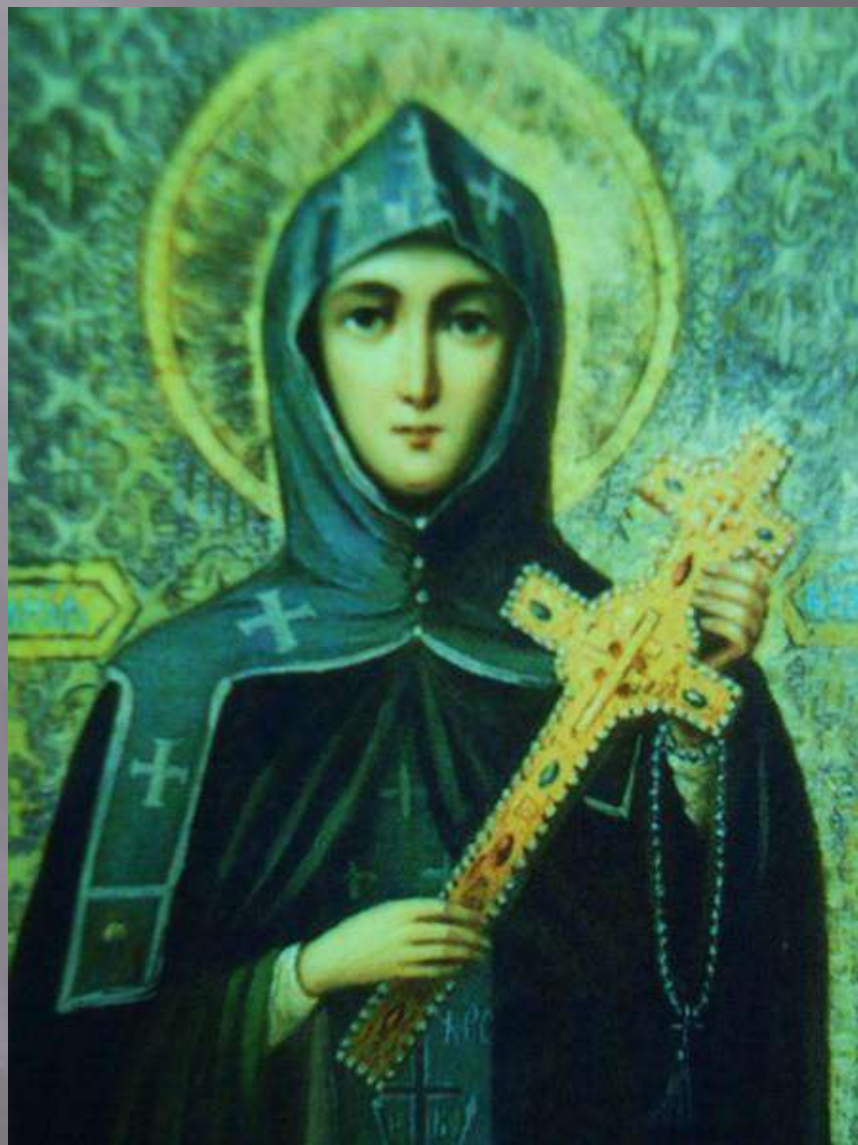
Преподобная Евфросиния Полоцкая