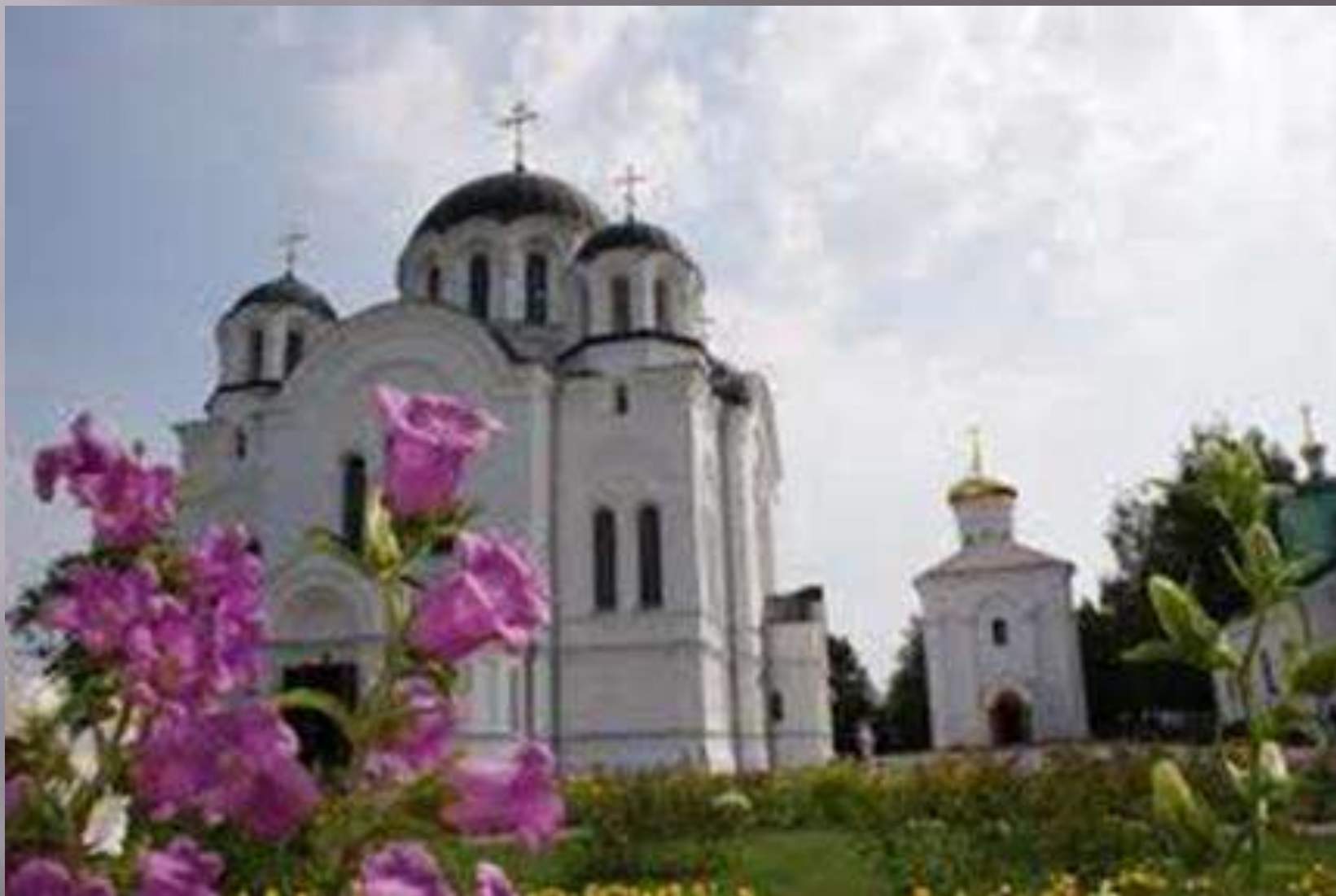
Спасо-Евфросиньевский монастырь В Полоцке.