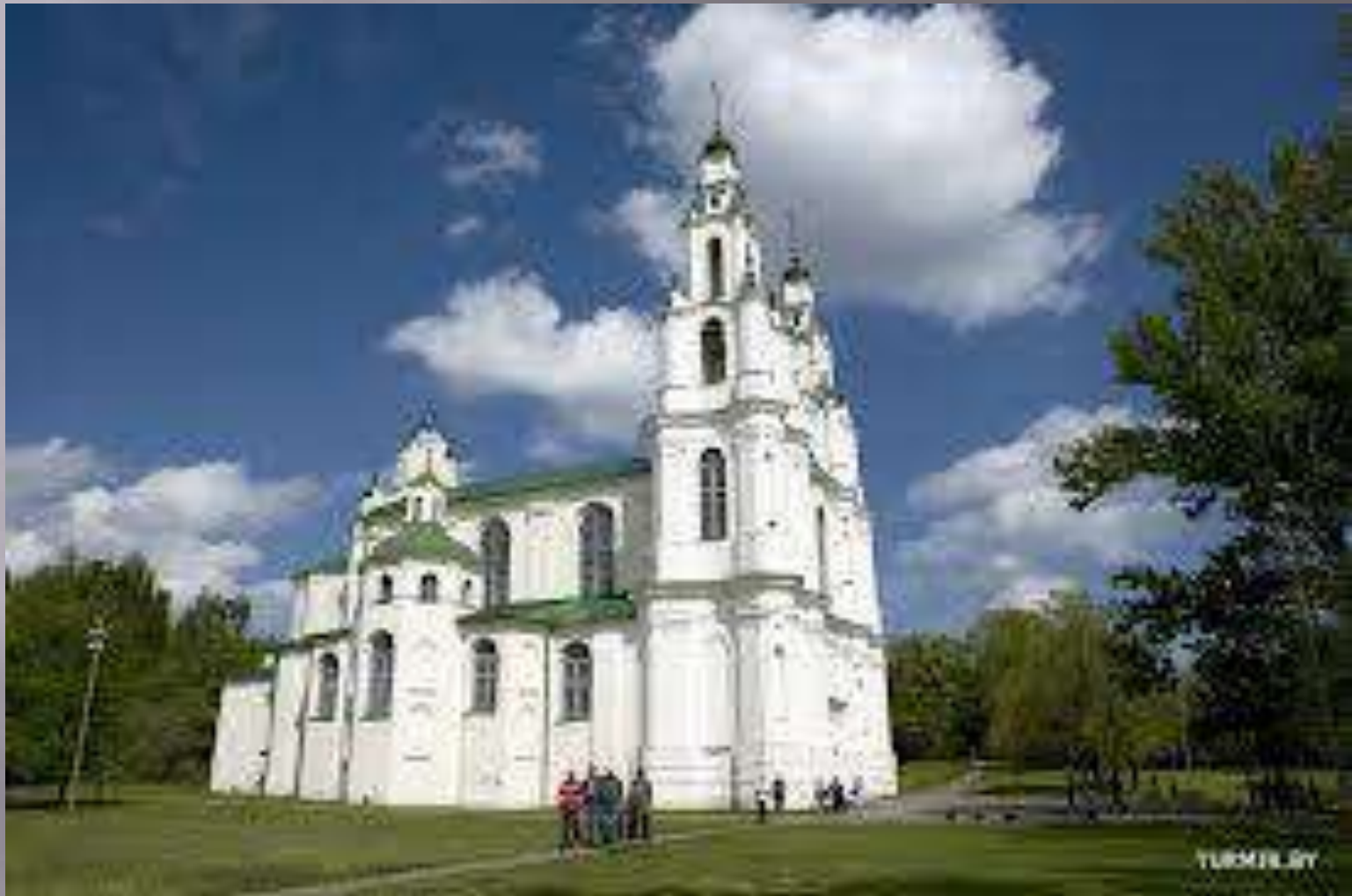
Современный вид Софийского собора в Полоцке.